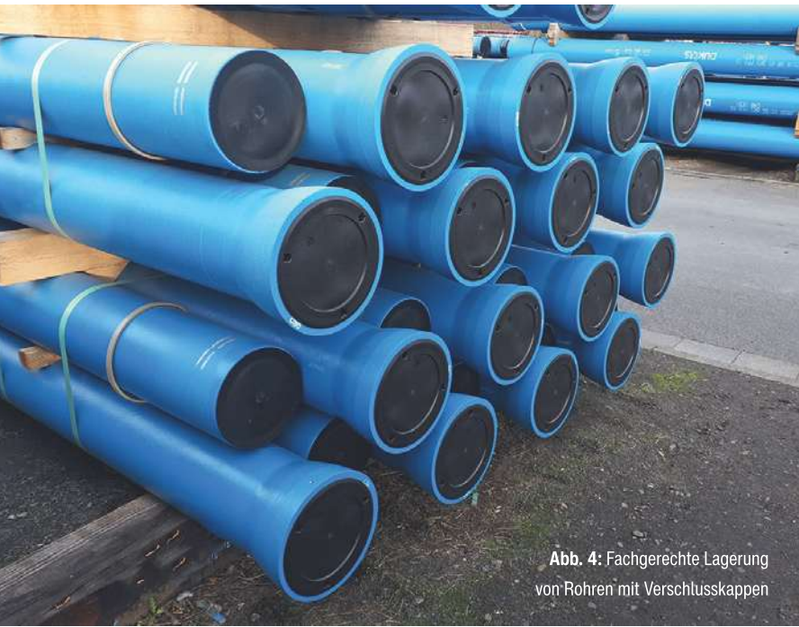
Abb. 4: Fachgerechte Lagerung von Rohren mit Verschlusskappen