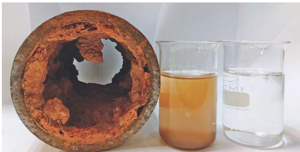
Abb. 1: Korrosionsschaden mit Beeinträchtigung der Wasserbeschaffenheit und der Hydraulik der Rohrleitung

Mit Zementmörtelauskleidungen lassen sich diese Schäden vermeiden (Abb. 2). Für neue Rohre und Formstücke stehen verschiedene Applikationsverfahren zur Verfügung. Bestehende Rohrleitungen lassen sich mit Verfahren