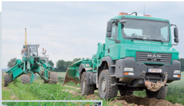
Verlegeflug und Zugeinheit